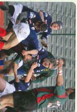
France Angleterre avec le XV parlementaire