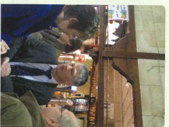
Café au café - Castres