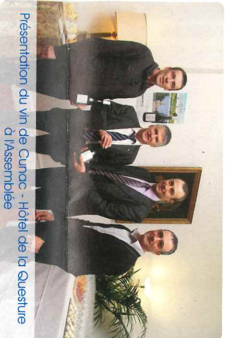
Présentation du vin de Curnac - Hôtel de la Questure à l'Assemblée

Réunis en congrès en septembre dernier, les membres de l'Alliance Centriste (parti fondateur de l'UDI, 13 sénateurs - 3 députés - 1 député européen) ont élu à l'unanimité un Président exécutif en la personne de Philippe FOLLIOT. Toujours au côté de Jean ARTHUIS, il a la lourde tâche d'ouvrir au rassemblement de la famille centriste et d'être le fer de lance dans la préparation et la mise œuvre des futures échéances électorales, tant départementales, régionales, que nationales. Philippe FOLLIOT vient d'intégrer l'équipe dirigeante de l'UDI.