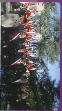
Cérémonie patriotique à Castres