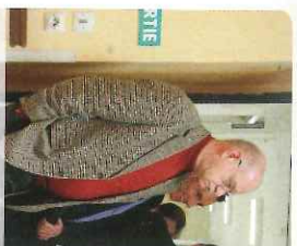
Visite de l'UMT