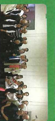
Remise des Ethylo-tests au Comité des fêtes du Torn à Réalmon

Depuis 2002 Philippe FOLLIOU mobilise ces fonds en toute transparence et équité. Dans une nouvelle circonscription de 89 communes, et avec des restrictions budgétaires, les modalités de répartition et d'attribution ont dû être revues. Ainsi en 2013, en 2014 et pour 2015, les 9/10 èmes des subventions au titre de la réserve parlementaire sont affectées pour des opérations principalement liées au patrimoine. Au cours de cette législature, l'ensemble des communes de sa circonscription, quelle que soit sa taille et la couleur politique de la municipalité, pourra obtenir cette aide (66 communes en ont déjà bénéficié). En parallèle, il soutient les associations en privilégiant les projets collectifs. (Omeps d'Albi, Comité des fêtes, Fédérations sportives,...). Ainsi par exemple en 2014, 5000 éthylo-tests ont été distribués aux comités des fêtes de la circonscription.