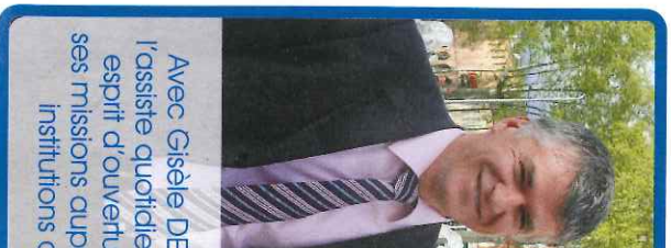
Avec Gisèle DE... l'assiste quotidien... esprit d'ouverture... ses missions cupr... institutions d...

Très préoccupé par les événements au Moyen-Orient et membre actif du groupe d'étude sur la défense des Chrétiens d'Orient, il s'est également rendu au Liban afin de témoigner des enjeux et difficultés de ce pays situé au cœur d'une région aussi sensible, notamment sur la situation humanitaire liée aux déplacements de populations venant de Syrie. Dans le cadre de cette visite, il a pu s'entretenir avec les soldats français de la FINUL au sud Liban.