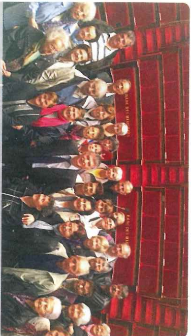
Avec les aînés ruraux de Laccoune dans l'hémicycle de l'Assemblée nationale