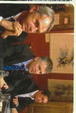
Soirée Rugby pour les Jeudis de la Bibliotéca - St-Pierre de Timisy