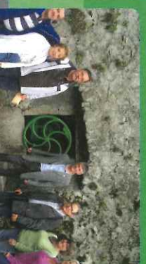
L'Assemblée nationale boit rouge avec le cumac