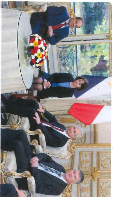
Au côté du Président Egyptien AL-SISSI, et de Claude Bartolone, Président de l'Assemblée nationale