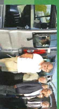
Achat du bus de l'OMEPS d'Albi