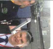
Redécoupage des cantons