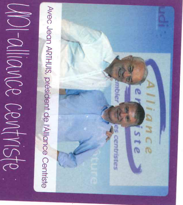
Avec Jean ARTHUIS, président de l'Alliance Centriste