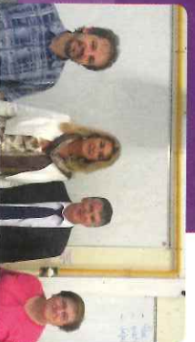
Visite du collège Aristide Bruant à Albi

LACCOUNE Le député FOLLIOT réalise l'ascension du Montalet