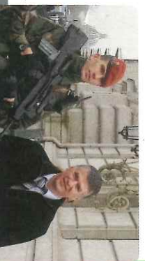
Avec les soldats du 8 ème RPIMa - Vigipirate à Paris