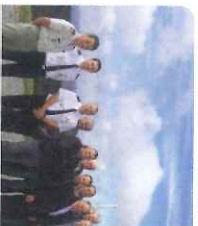
Visite de la staiti