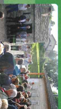
Le député invite les nouveaux maires