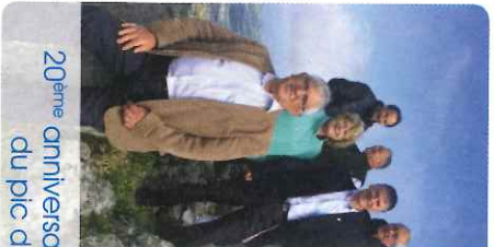
20 ème anniversaire du pic d