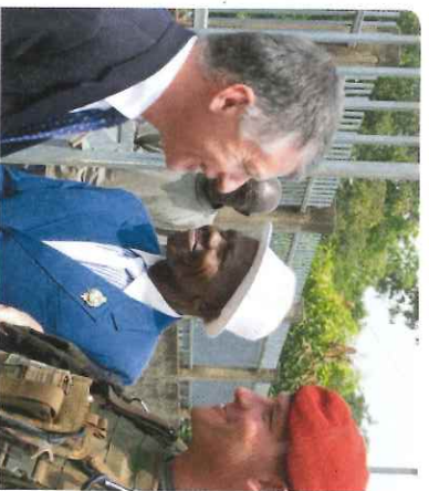
Avec le chef de corps du 8 ème RPIMA à Bangui