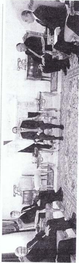
الرئيس السيسي خلال استقباله وفدا من البرلمان الفرنسي

كتب - أحمد سامي مطولي - شهد الرئيس عبدالفتاح السيسي على سفيرة عروب الشهور المصرية الفرنسية، كاترين ماريون، حفلًا استقبلها في مقر الرئاسة بالقاهرة. وتناول اللقاء العلاقات بين البلدين والشعبين الصديقين، بحضور السفير الفرنسي بوزارة الخارجية، الدكتور عمرو أبو هنيدي، والسفير المصري بالقاهرة، الدكتور محمد حجازي، والسفير الفرنسي في مصر، نيل جوهو، وعضو البرلمان الفرنسي، جان-بيير كوفييه، ورئيس مجلس النواب الفرنسي، ميشال ديلين، وعضو البرلمان الفرنسي، جان-ييف كوكو، وعضو البرلمان الفرنسي، جان-ييف كوكو، وعضو البرلمان الفرنسي، جان-ييف كوكو.