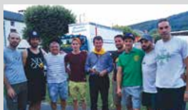
> Comité des fêtes de Brassac