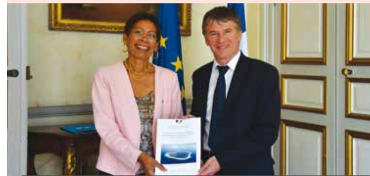
> Remise du rapport sur l'île de Clipperton à Madame George PAU-LANGEVIN, Ministre de l'Outre-mer