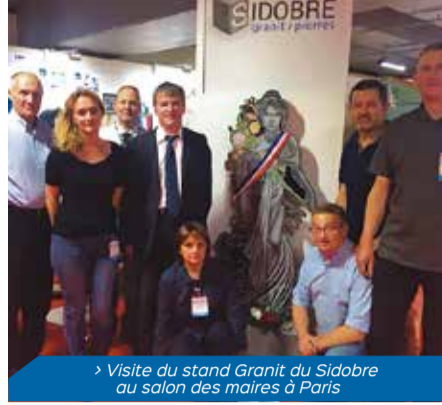
> Visite du stand Granit du Sidobre au salon des maires à Paris