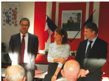
> Inauguration du haut-débit à Trébas