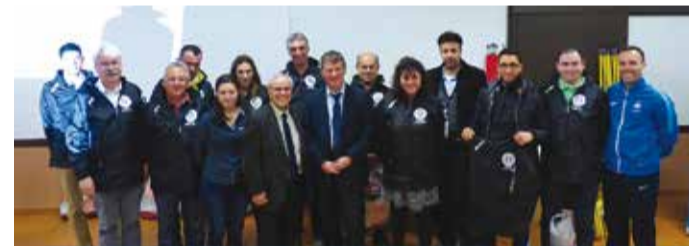
> Trophées du District de football à Burlats

De plus, dans le cadre de cette enveloppe, Philippe FOLLIOT accompagne les associations en privilégiant des projets collectifs (Fédération de pêche, Association départementale des aînés ruraux, OMEPS de Saint-Juéry...) et pour la cinquième année consécutive il a renouvelé l'opération avec l'Union Départementale des Comités des Fêtes visant à acheter 5 000 éthylotests distribués aux comités des fêtes de la circonscription.