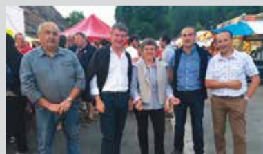
> Fête de Murat-sur-Vèbre