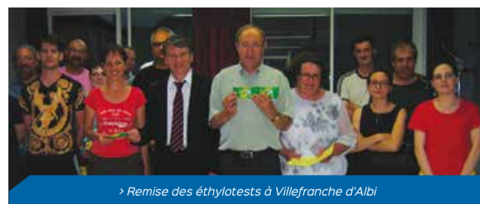
> Remise des éthylotests à Villefranche d'Albi