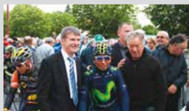
> Départ de la Route du Sud