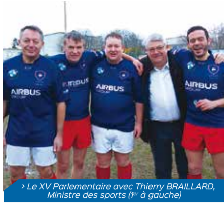
> Le XV Parlementaire avec Thierry BRAILLARD, Ministre des sports (1 er à gauche)

Déposant une proposition de loi sur les buralistes relative à la mise en place d'un nouveau contrat d'avenir pour la profession , il a défendu une hausse de leur rémunération et une stricte application du protocole de l'OMS visant à lutter contre le trafic transfrontalier.