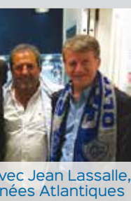
> Avec Jean Lassalle, députés Atlantiques

L'élu local inspire l'élu national dans chacune de ses prises de position et dans chacun de ses votes à l'Assemblée nationale !