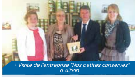
> Visite de l'entreprise "Nos petites conserves" à Alban