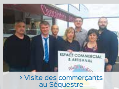
> Visite des commerçants au Séquestre