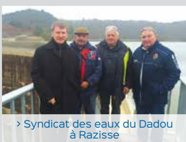
> Syndicat des eaux du Dadou à Razisse