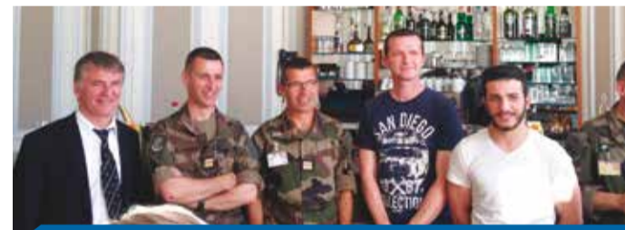
> Inauguration au Mess Beaudecourt à Castres