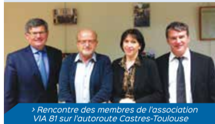
> Rencontre des membres de l'association VIA 81 sur l'autoroute Castres-Toulouse