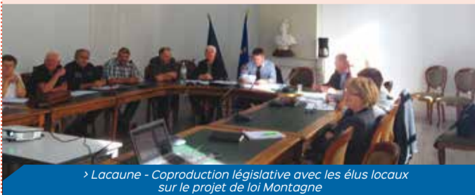
> Lacaune - Coproduction législative avec les élus locaux sur le projet de loi Montagne

PORTE-PAROLE DU GROUPE UDI SUR LE PROJET DE LOI DE MODERNISATION, DE DÉVELOPPEMENT ET DE PROTECTION DES TERRITOIRES DE MONTAGNE, IL A DÉFENDU, EN SÉANCE PUBLIQUE, L'ÉQUITÉ ENTRE LES TERRITOIRES DE MONTAGNE ET LES ZONES URBAINES, A SOUHAITÉ LA PRISE EN COMPTE DES SPÉCIFICITÉS DE LA MONTAGNE ET A OBTENU L'ADOPTION D'AMENDEMENTS SUR L'ÉCOLE, LA SANTÉ, LA LUTTE CONTRE LES ZONES BLANCHES OU ENCORE LES TRAVAUX DE MODERNISATION DES RÉSEAUX D'EAU ET D'ASSAINISSEMENT.