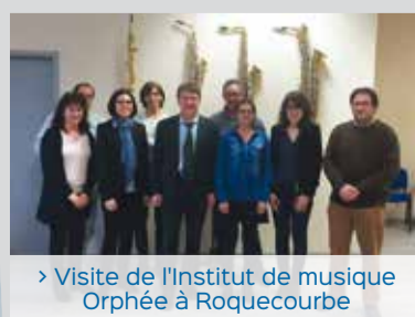
> Visite de l'Institut de musique Orphée à Roquecourbe

L'IGP Jambon de Lacaune présentée à l'Assemblée Nationale