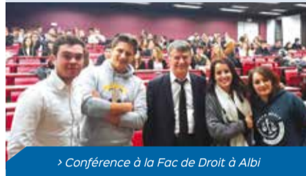
> Conférence à la Fac de Droit à Albi