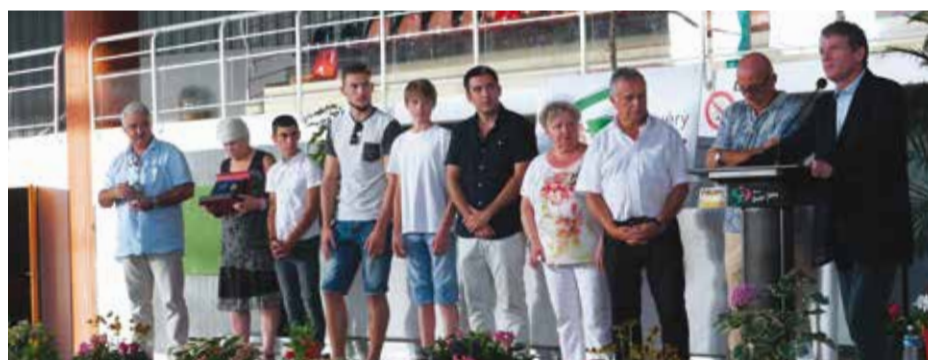
> Forum des associations à Saint-Juéry