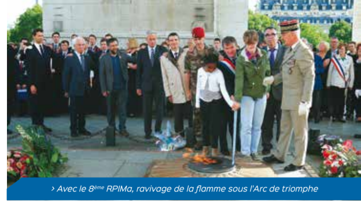
> Avec le 8 ème RPIMA, ravivage de la flamme sous l'Arc de triomphe