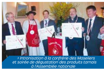
> Intronisation à la confrérie des Maselliers et soirée de dégustation des produits tarnais à l'Assemblée nationale