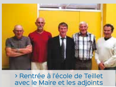
> Rentrée à l'école de Teillet avec le Maire et les adjoints