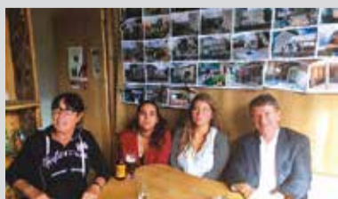
> Café associatif à Lamontalerié