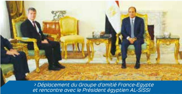
> Déplacement du Groupe d'amitié France-Egypte et rencontre avec le Président égyptien AL-SISSI

De plus, il a accompagné Monsieur Claude BARTOLONE, Président de l'Assemblée nationale, au Maroc afin d'inaugurer un jumelage institutionnel entre la Chambre des représentants du Maroc et la Chambre des députés français.