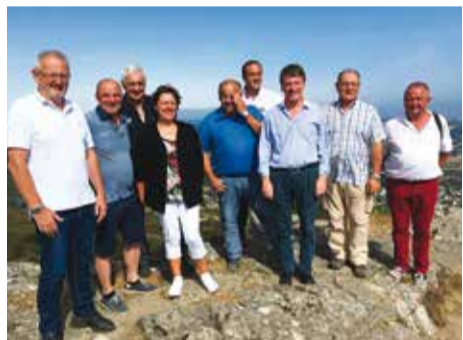
> Traditionnelle ascension du Pic du Montalet avec les élus locaux

Enfin, aux côtés de Philippe BONNECARRÈRE, Sénateur du Tarn, il s'est rendu dans les locaux de la gendarmerie de Castres, à la maison d'arrêt d'Albi et au commissariat d'Albi afin de rencontrer le personnel pénitentiaire, de la gendarmerie et de la police mobilisés dans la lutte contre la délinquance et le terrorisme.