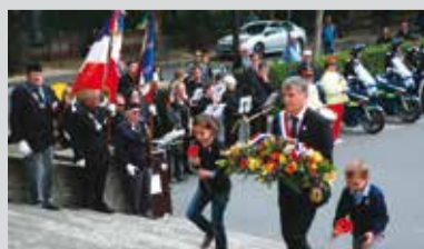
> Cérémonie du 8 mai à Albi

Dans la continuité de son rapport, pour visiter les bases scientifiques, il a personnellement pris en charge son déplacement dans les T.A.A.F (Iles Kerguelen, Crozet, Amsterdam...), étant ainsi le deuxième député de l'histoire à se rendre dans ces lointaines régions les plus reculées de la République.