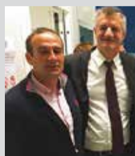
> Match CO-Pau au Député des Pyrénées

Tarn Philippe Folliot élu président de l'Alliance Centriste