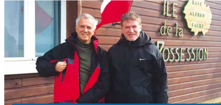
> Déplacement aux Terres Australes et Antarctiques Françaises