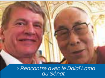
> Rencontre avec le Dalai Lama au Sénat